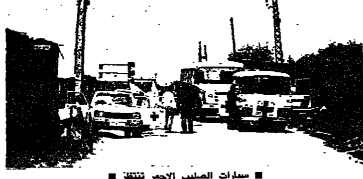
سيارات الصليب الاحمر تنتقل